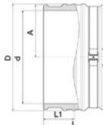
Diamètres 450 à 900 mm